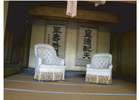
▲明治天皇と皇后がお座りになった玉座

そして道路を挟んで向かいには、旧国鉄の長浜駅を使った「長浜鉄道スクエア」。隧道にあった石碑や明治の頃の駅の様子を再現した部屋など・・・別段、鉄道オタクって訳ではないのですが、結構、興奮です。