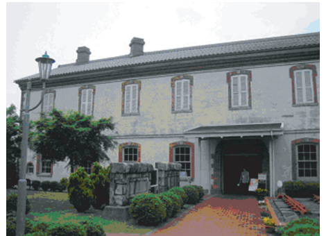
▲長浜鉄道スクエア

そして道路を挟んで向かいには、旧国鉄の長浜駅を使った「長浜鉄道スクエア」。隧道にあった石碑や明治の頃の駅の様子を再現した部屋など・・・別段、鉄道オタクって訳ではないのですが、結構、興奮です。