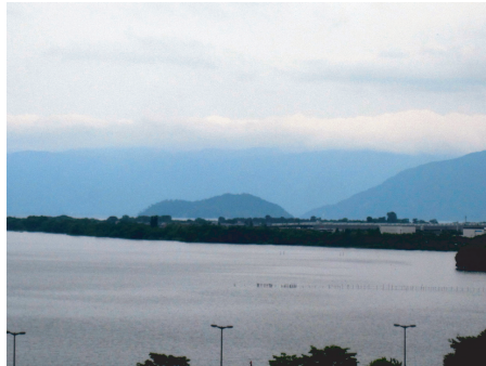
▲天守閣からの琵琶湖の眺め

長浜駅からすぐに豊公園があって・・・長浜城・・・これは元来のものではなく、今は資料館になっていて、犬山城や伏見城をモデルに復元したいるだけなのですが、太閤さんの城下町なんですね！そして琵琶湖ですが、残念ながら曇天！